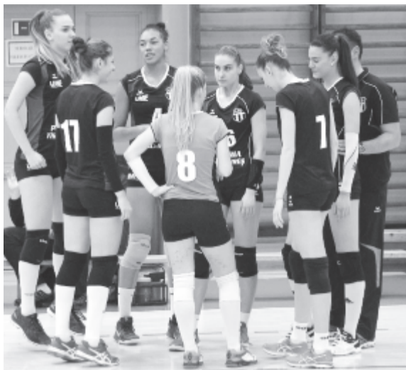
Hiába a bizakodás a marosvásárhelyi táborban: bár a Medicina CSU az előkészületi mérkőzések során többször is legyőzte a lugosiakat, ezúttal három játszmában a bánságiak bizonyultak jobbnak. Képünk egy korábbi, hazai mérkőzésen készült.

A második és harmadik játszmákban aztán már egyértelműen hazai fölény alakult ki, 8-9 pontos lugosi vezetéssel, amit már nem lehetett behozni.